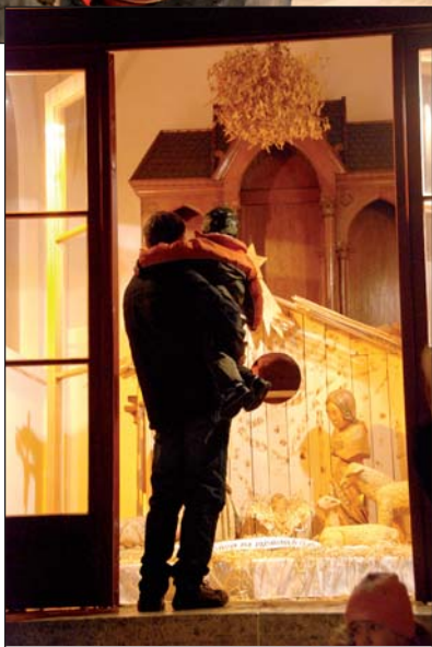
Betlém v kapli Sv. Rocha si ratolesti oblíbily.