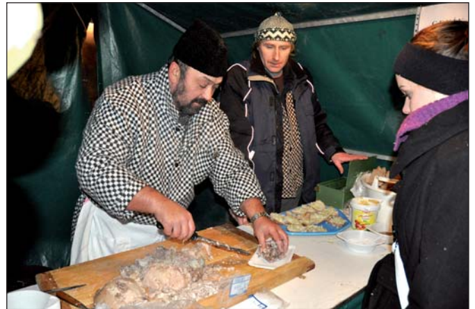
Pochoutky ze zabijačky byly žádané.