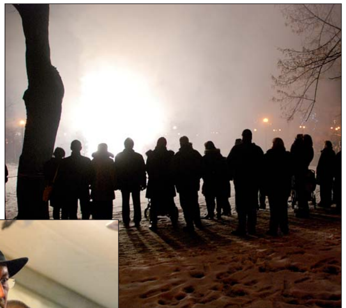
Tichý ohňostroj zaujal stovky příchozích.