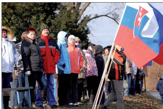
Akci si nenechaly ujít stovky diváků.