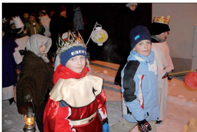
Tři králové kráčeli ulicemi Staré Břeclavi.