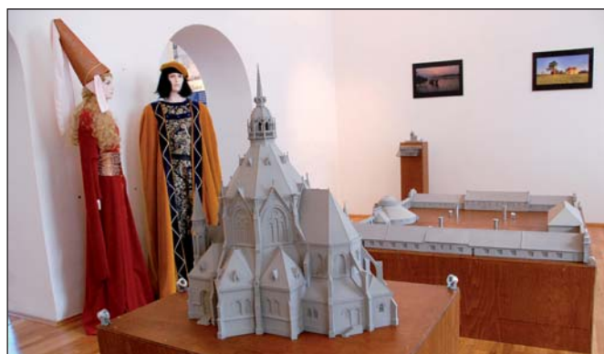
Expozici miniatur mohou návštěvníci od konce minulého roku spatřit v Lichtenštejnském domě.

Hlavním důvodem bylo zjištění reálného stavu po dvou měsících provozu pavilonu. Na začátku prosince jsme se sešli společně s dalšími zainteresovanými Pokračování na str. 5