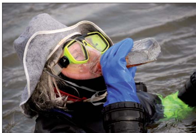
Některým plavcům ledová Dyje evidentně nevalila.