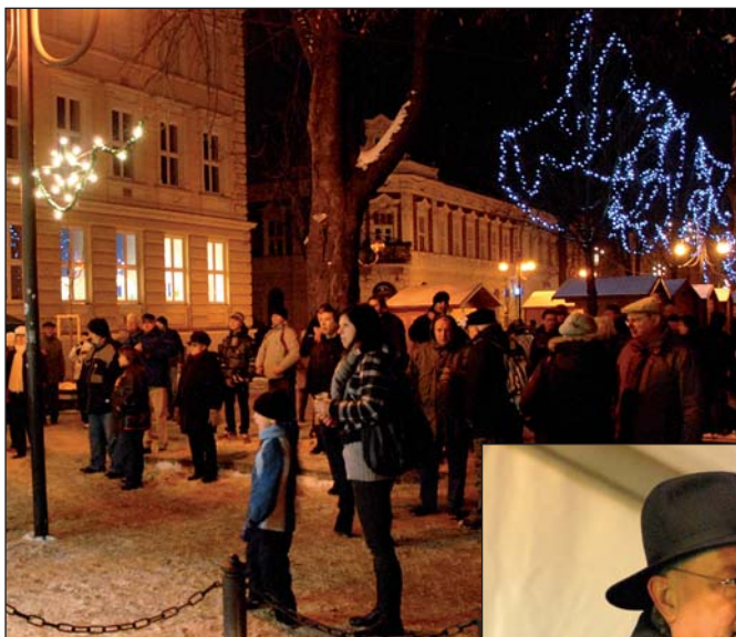
Pěší zónou proudily davy lidí.