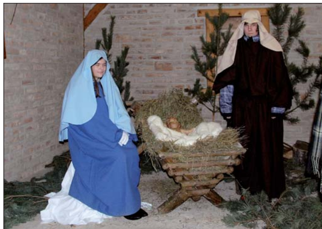
Ve Staré Břeclavi nechyběl živý Betlém s jesličkami.