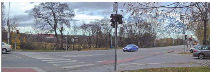
Plánovaný hobby market by negativně ovlivnil pohled na zámek a zlikvidoval pohledově určující strukturální prvky v krajině.

„Z dokumentace mimo jiné vyplývá, že způsob likvidace dešťových vod má být vyřešen vsakováním; to považujeme za zcela nevhodné řešení. Kromě toho společnost bagatelizovala i další vlivy obchodního centra na okol-