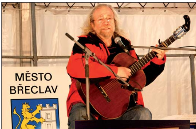
Břeclavskou vánoční atmosféru doplnil známý písničkář Jaroslav Hutka.