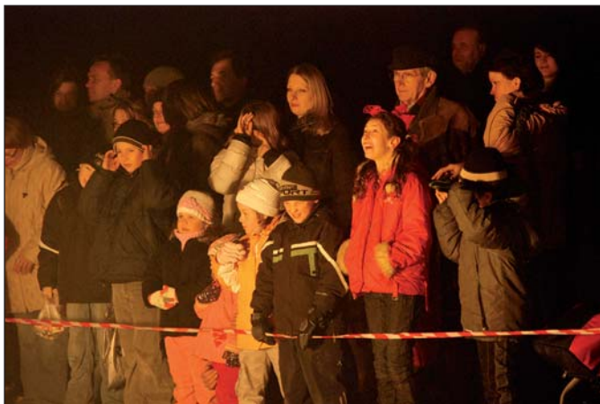
Ohňostroj si užívaly starší i mladší ročníky.