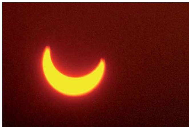
Díky slunečnému počasí se Břeclavané mohli 4. ledna ráno pokochat neobvyklým úkazem, zatměním slunce z 80%. Podobný jev, ale s menší intenzitou, přitom bude možné v České republice pozorovat nejdříve za čtyři roky. Z 80% zakryje měsíční stín slunce až v roce 2026. (dav)