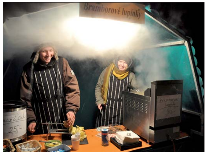
Na poštoreském jarmarku mohli lidé ochutnat čerstvě usmažené bramborové lupínky.