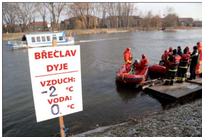
Teplota vody byla těsně před zamrznutím.